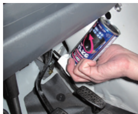
狭い箇所でも使いやすい