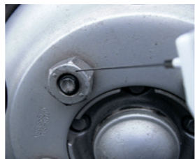
ボルト・ナットの緩めに