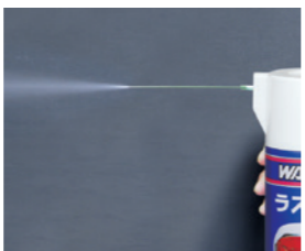
防錆目的で均一に広範囲に噴霧できる霧状タイプ