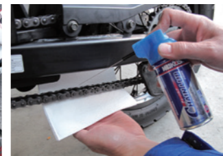
クリアな薄い被膜で汚れがつきにくい