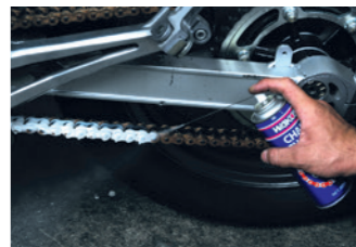
チェーン全体をコーティング