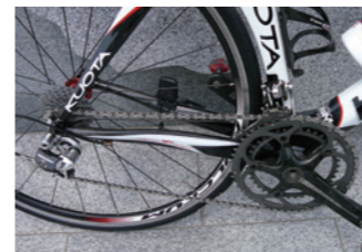
薄い被膜がフリクションを低減。強い付着性でロングライドにも対応