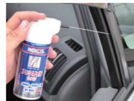
ランチャンネルの潤滑を良くし、ヒビ音を防止