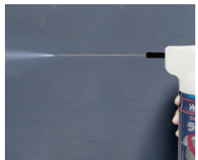
少量噴射のコントロール性に優れた霧状タイプ