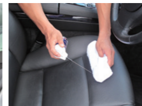
レザーシートの艶出しに最適