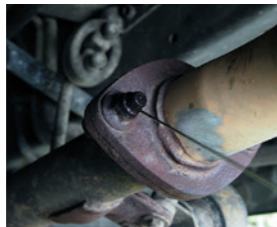
余熱の残るネジの緩めにも原液だから効果的