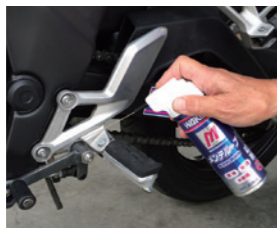
稼働部分の潤滑性を向上し作動をスムーズに