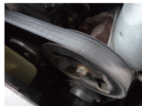
ファンベルトの鳴き止めに効果を発揮