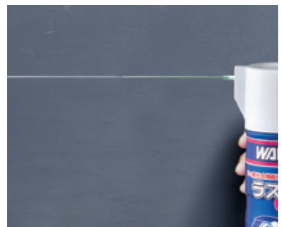
原液を直接必要箇所に噴射する直噴タイプ