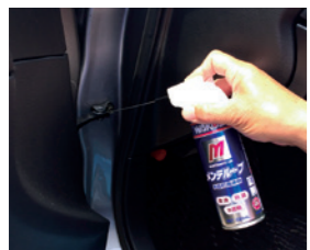
ドアヒンジなどプレートの間隙に浸透して潤滑